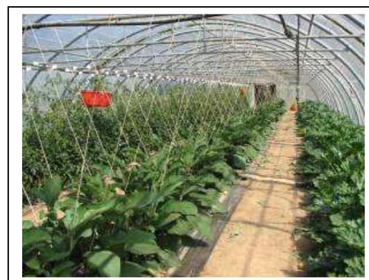
Photo des cultures :

Deux autres tunnels sont en monoculture de courgette (T5) et de melon (T3). Les deux tunnels T3 et T4 sont voisins alors que le T5 est isolé et situé à 200m des deux autres.