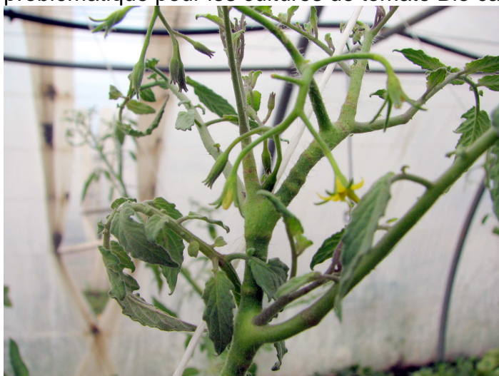
Apex de tomate bloqué par N.tenuis

Dernière décade de juillet, des dégâts importants sont apparus en culture de tomate. Les piqures nutritionnelles de Nesidiocoris tenuis ont entraîné la formation d'anneaux nécrosés qui ont évolué en boursouflures et bloqué la croissance des apex (voir photo). La production de fruits a été interrompue. On pouvait compter de 6 à 17 N.tenuis par apex, avec tous les plants atteints, aucune autre espèce de miride n'est présente sur tomate. A la même période sur le rang d'aubergine voisin on retrouvait une diversité de mirides : Macrolophus caliginosus , Dicyphus errans , Dicyphus tamaninii et quelques petits foyers d'aleurodes. Il semblerait que les individus de N.tenuis présents aient préféré s'alimenter sur les tomates plutôt que de consommer des aleurodes sur les aubergines. Suite à ce constat une tournée d'observation de cultures de tomate est réalisée sur plusieurs sites de production Bio du Roussillon. La présence d'anneaux sur les apex est constatée sur toutes les parcelles mais sur aucun site les plantes ne sont bloquées. Après une arrivée discrète en 2008, Nesidiocoris tenuis est donc présente sur l'ensemble du Roussillon. Sa prolifération risque d'être problématique pour les cultures de tomate Bio car nous ne disposons pas de moyen de lutte.