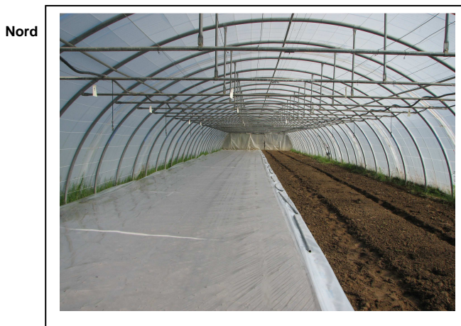
Pose de la solarisation Est le 12 juin

Nous constatons une réduction importante des indices de galles mesurés sur la tomate par rapport à ceux mesurés sur la courgette.