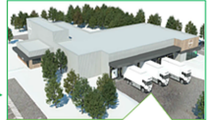
Unité de mise en carcasse et stockage