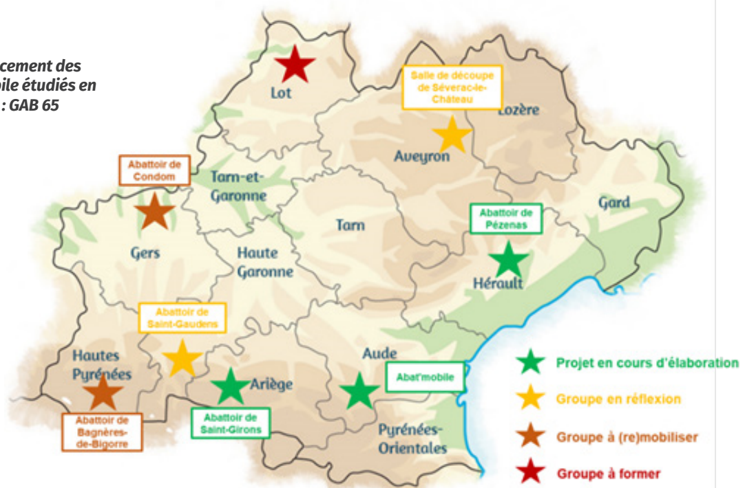
Carte de l'état d'avancement des projets d'abattage mobile étudiés en Occitanie

La carte ci-dessous présente les 8 projets identifiés selon leur état d'avancement, sachant qu'aucun d'entre eux n'a encore pu entamer la phase d'expérimentation permise par la loi.