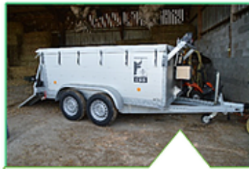
Saignée dans le caisson mobile (acquis par l'AALVie) puis transport vers l'unité.