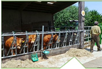
Contention et étourdissement sur la ferme

Les bovins sont étourdis sur leur lieu de vie par le personnel de l'unité, saignés dans les caissons mobiles puis Lacheminés vers l'unité de mise en carcasse. Ces caissons font le lien entre l'unité et les fermes dans un rayon géographique d'une heure de route. Dans l'unité, les carcasses sont préparées jusqu'à la mise en quartier. L'éleveur.euse reste propriétaire de la carcasse et libre de sa destination (ateliers de découpe, boucheries, magasins spécialisés, retour à la ferme...). Une filière locale territoriale est en construction avec les collectivités et les acteurs de la filière longue.