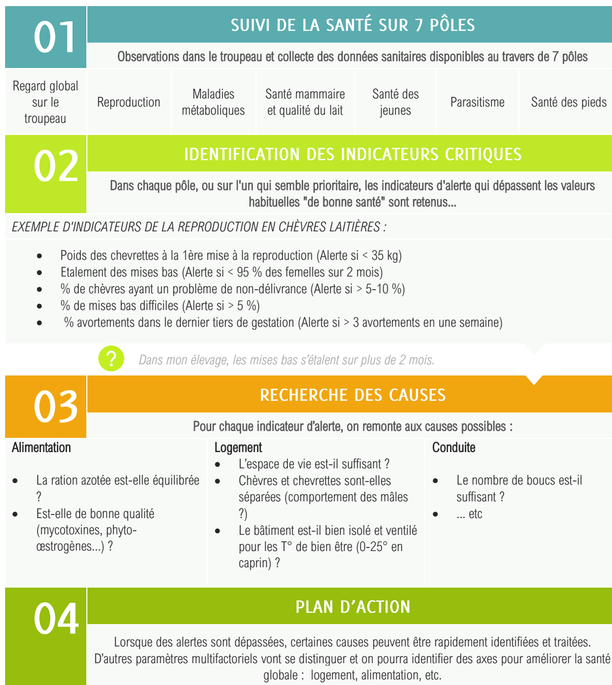
Fig.2 : Déroulement de la méthode Panse-Bête :

Elle permet de remonter aux causes d'un souci de santé, et d'envisager dans leur globalité des facteurs que l'on n'aurait pas forcément pensé à mettre en relation.