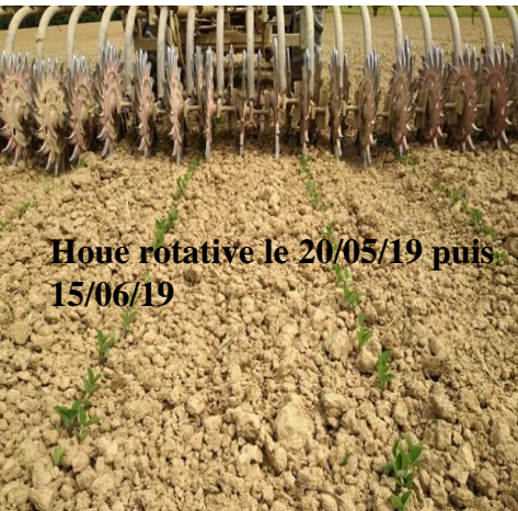
Houe rotative le 20/05/19 puis 15/06/19

Environ 115 litres/Ha de consommation de fuel