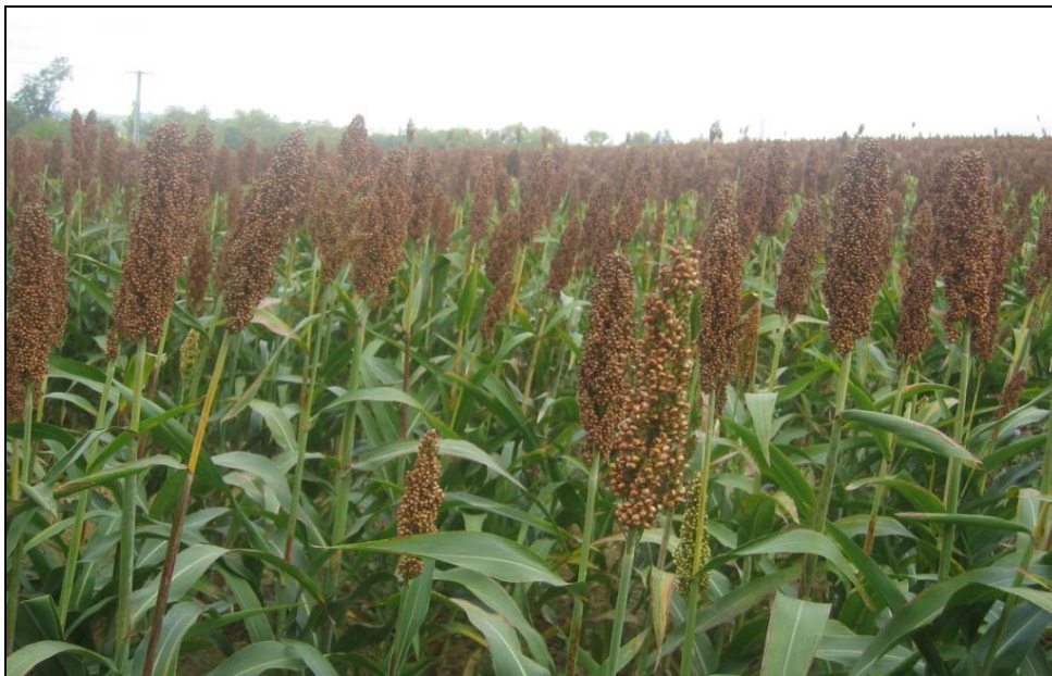
Sorgho à maturité le 8 octobre 2010

C.R.E.A.B. Midi-Pyrénées LEGTA Auch-Beaulieu 32020 AUCH Cedex 09