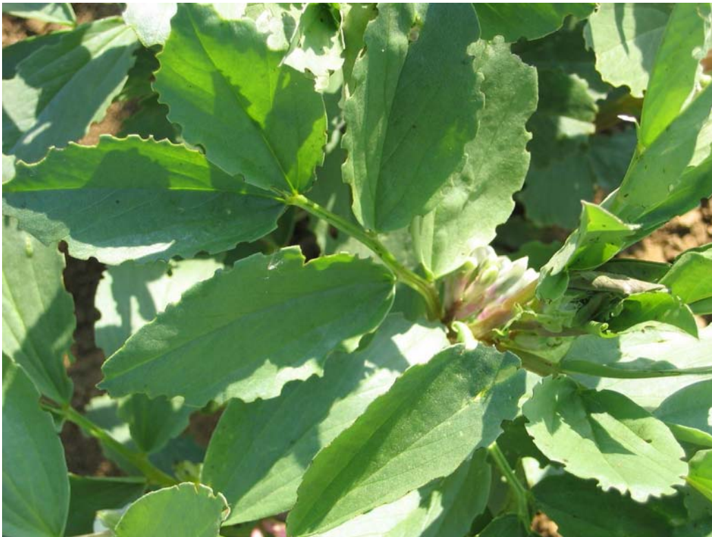
Gros plan de féverole

Action réalisée avec le concours financier :