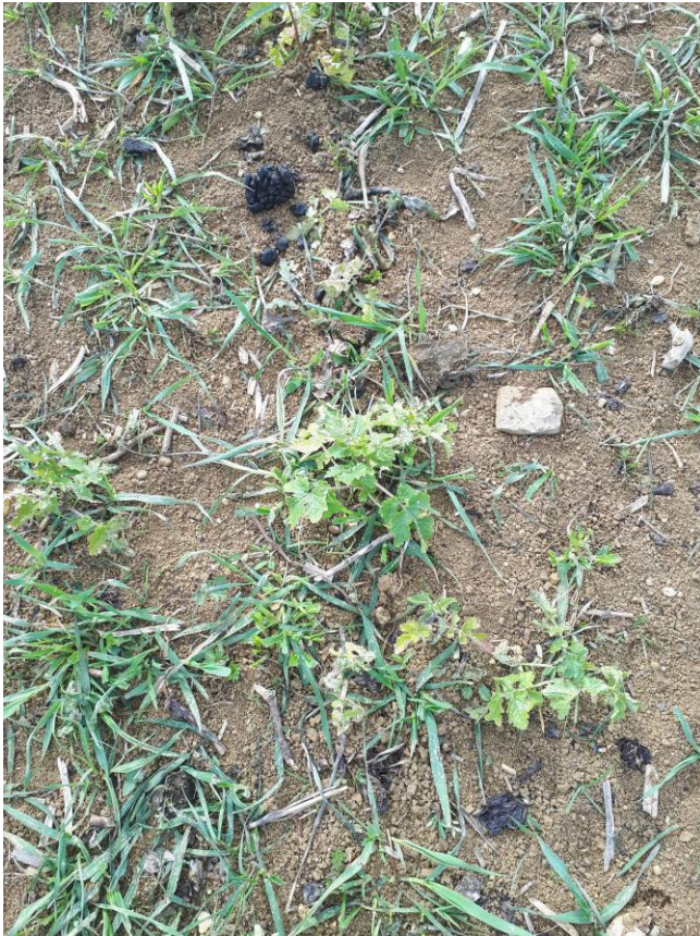
Lendemain de 2 ème pâture

Méteil : avoine + orge + vesce + féverole + pois + moutarde b.