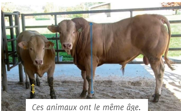
Ces animaux ont le même âge.

Pour déterminer la précocité observer 3 postes de développement squelettique :